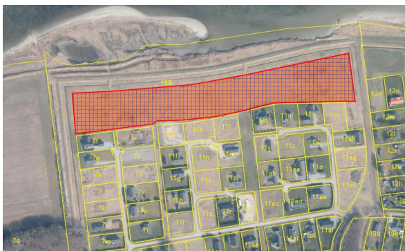
Plejeareal iht. vilkår nr. 8 er markeret med rødt og krydsskravering.