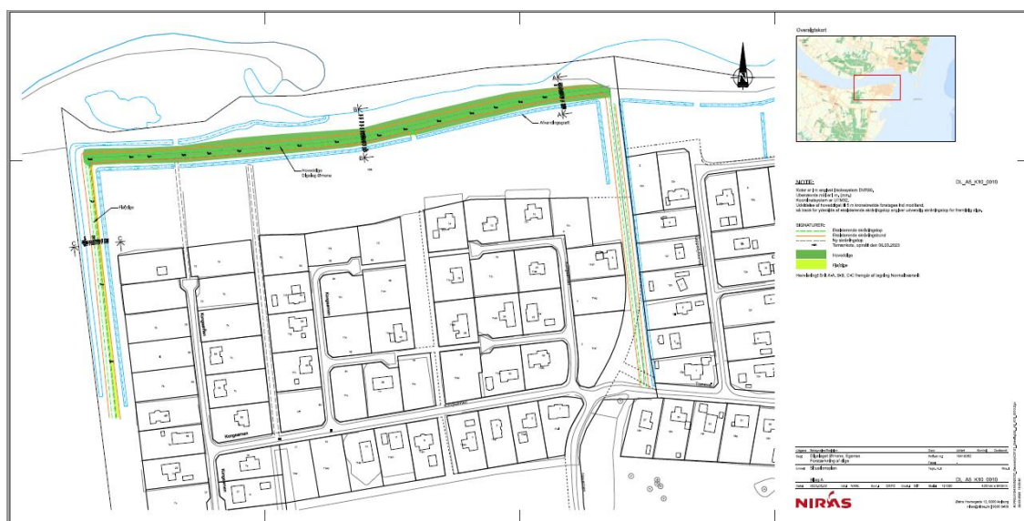
Oversigtskort over digelagets område og diger, som ønskes forstærket.

I medfør af kystbeskyttelseslovens §3a stk.2 er der i tilladelsen inkluderet en dispensation iht. naturbeskyttelseslovens §65 fra lovens §3 til inddragelse af ca. 2800 kvadratmeter beskyttet natur. Endvidere er der i medfør af kystbeskyttelseslovens §3a stk.3 stillet vilkår med hjemmel i vandløbsloven om, at projektet ikke må påvirke vandløb på stedet.